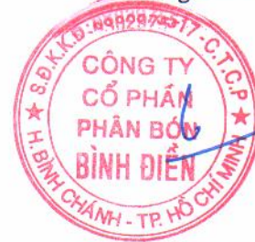
LÊ QUỐC PHONG