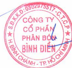
LÊ QUỐC PHONG