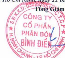
LÊ QUỐC PHONG